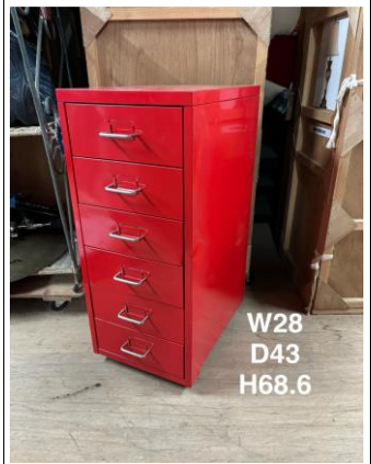
デスク脇・ドロワー3-4