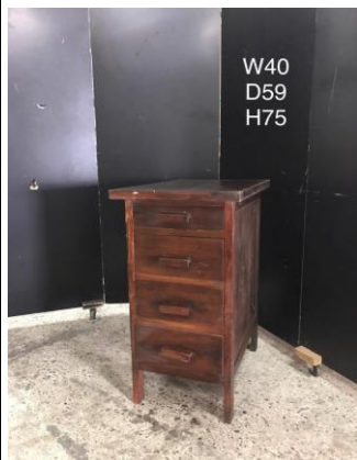
デスク脇・ドロワー3-9