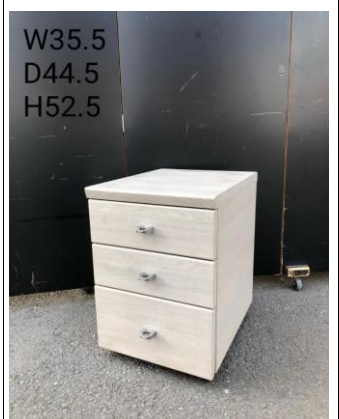
デスク脇・ドロワー3-16