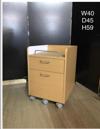
デスク脇・ドロワー3-6