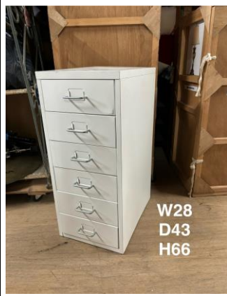
デスク脇・ドロワー3-1