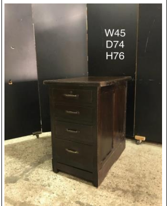
デスク脇・ドロワー3-12