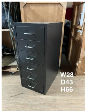
デスク脇・ドロワー3-3