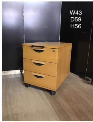
デスク脇・ドロワー3-7