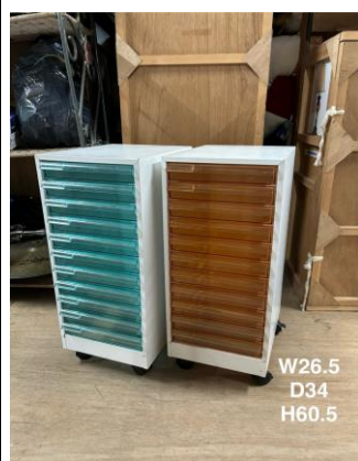
デスク脇・ドロワー3-13