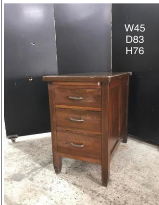
デスク脇・ドロワー3-10