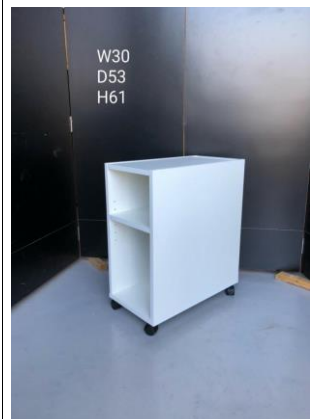
デスク脇・ドロワー3-14