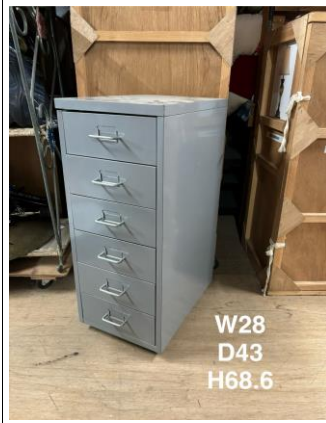
デスク脇・ドロワー3-2