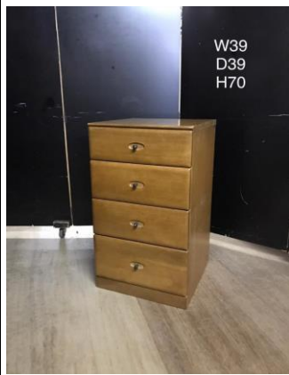
デスク脇・ドロワー3-5