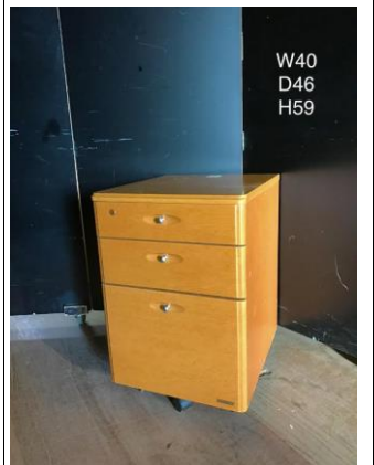
デスク脇・ドロワー3-8