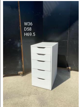
デスク脇・ドロワー3-15