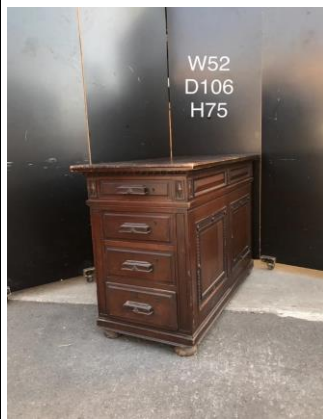
デスク脇・ドロワー3-11