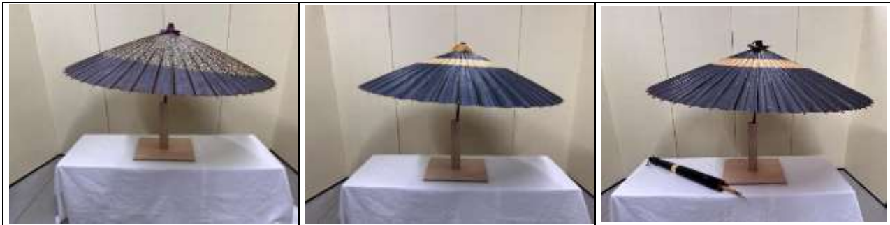
蛇の目傘 唐草柄入り 紺